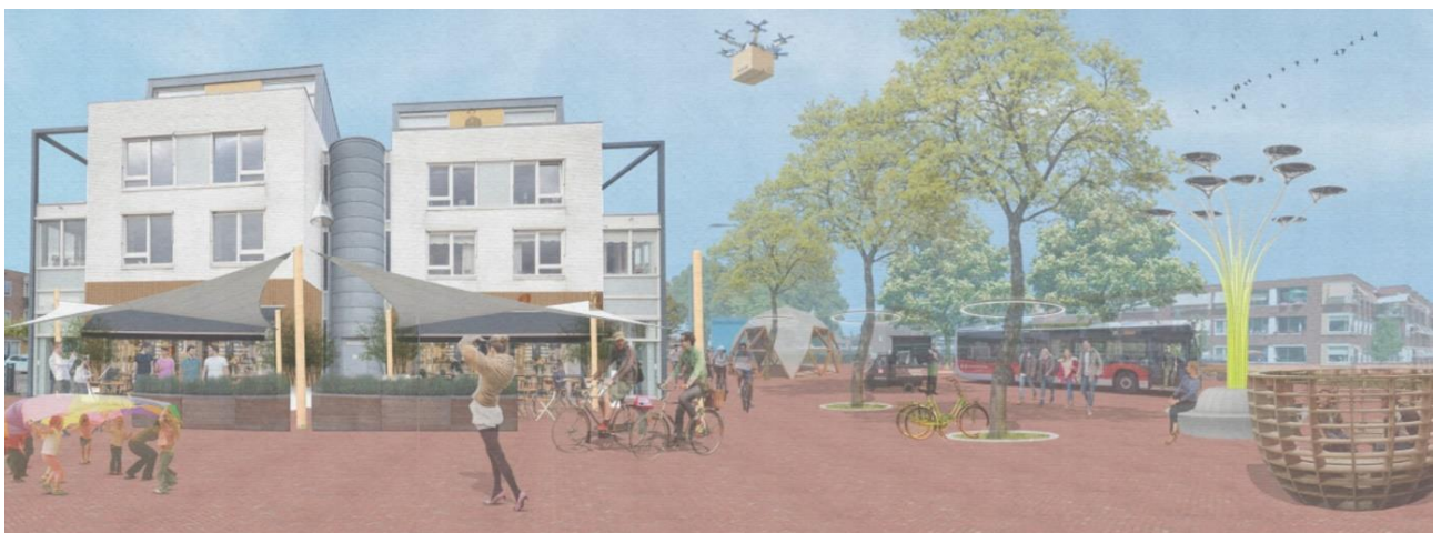
De afbeelding in dit document zijn slechts om een beeld te schetsen van wat er mogelijk is, er ligt nog niets vast.

06-83 05 22 76 • y.timmer@biblionetdrenthe.nl